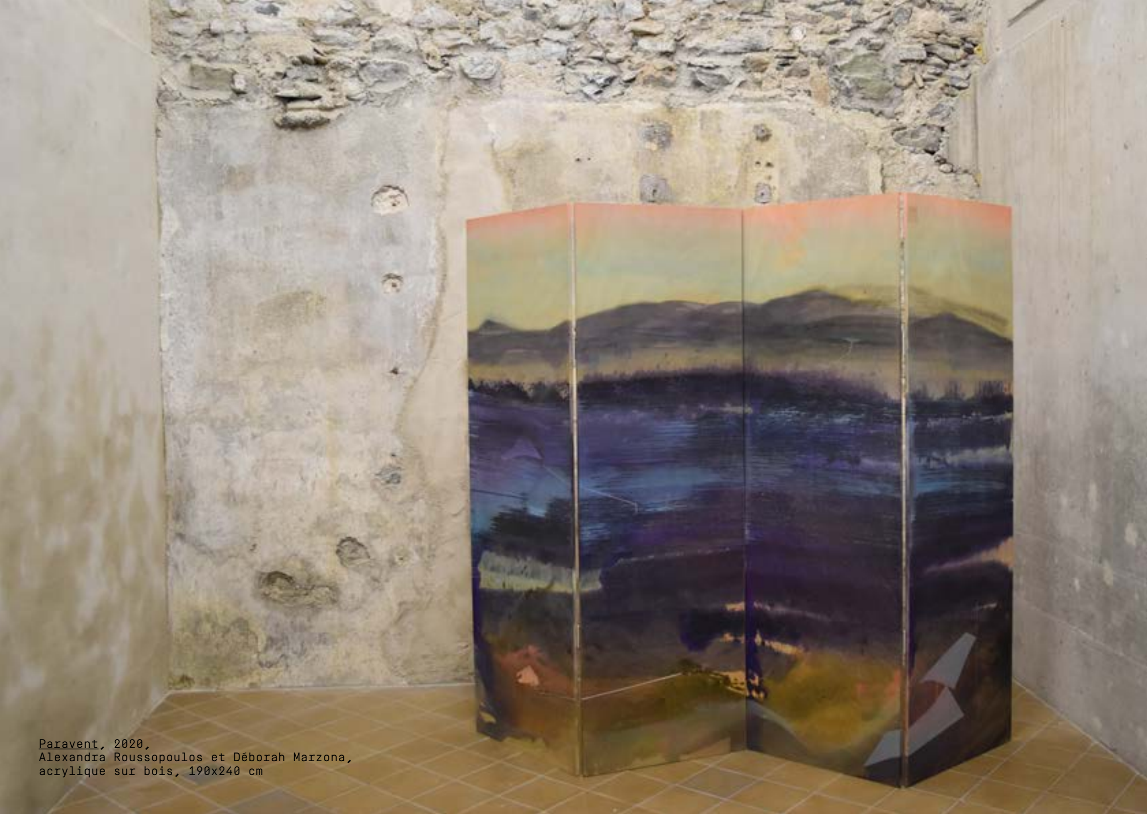
Paravent, 2020, Alexandra Roussopoulos et Déborah Marzona, acrylique sur bois, 190x240 cm