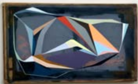
Volante VI , 2021, acrylique sur écran sérigraphique, 77x140 cm